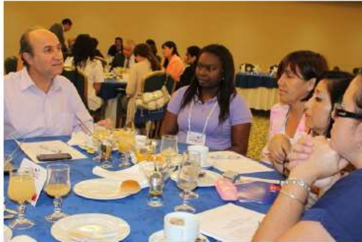
Trabajo en grupo del equipo n°3