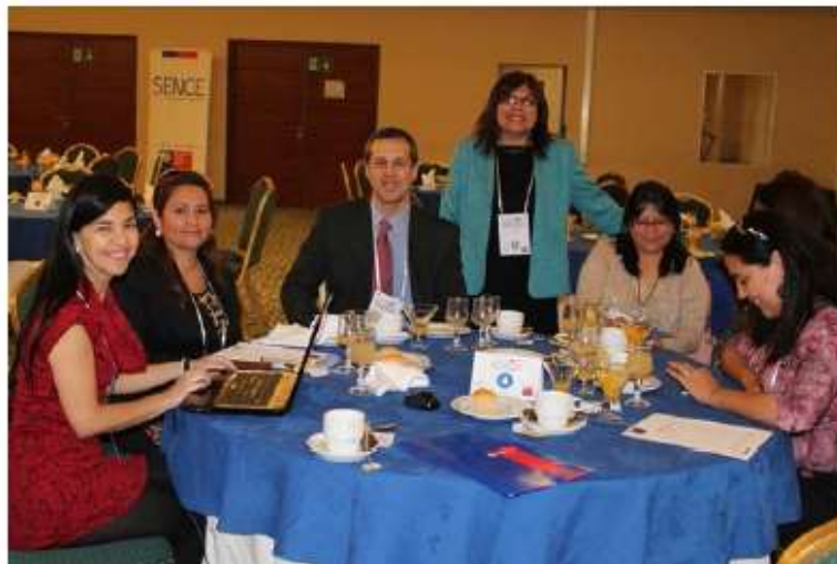
Trabajo en Grupo. Integrantes del grupo n°4 junto a la Directora Regional (PT) del Sence