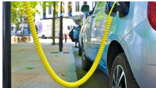
"La transición hacia una economía de cero emisiones netas de carbono podría crear 15 millones de nuevos empleos en América Latina para 2030", proyecta Adrien Vogt-Schilt del BID.