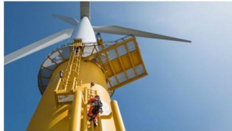
Los trabajos verdes con mayor tasa de empleabilidad entre 2019 y 2029 en Estados Unidos: técnicos de turbinas eólicas e instaladores solares fotovoltaicos.