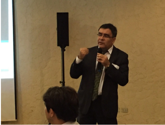
Autoridades dirigiéndose a participantes