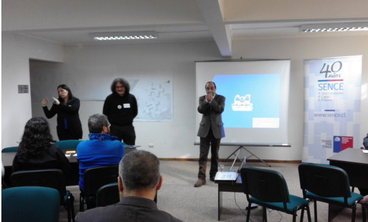
Autoridades (intérprete a la izquierda)