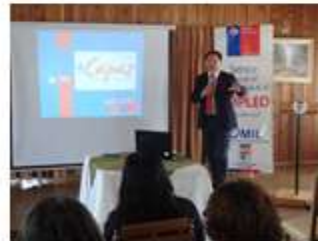
Unidad de Estudios 18 de Marzo 2011