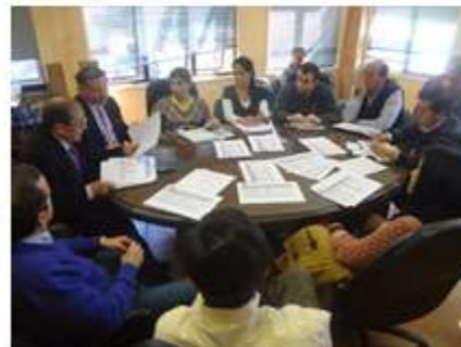
Unidad de Estudios 18 de Marzo 2011