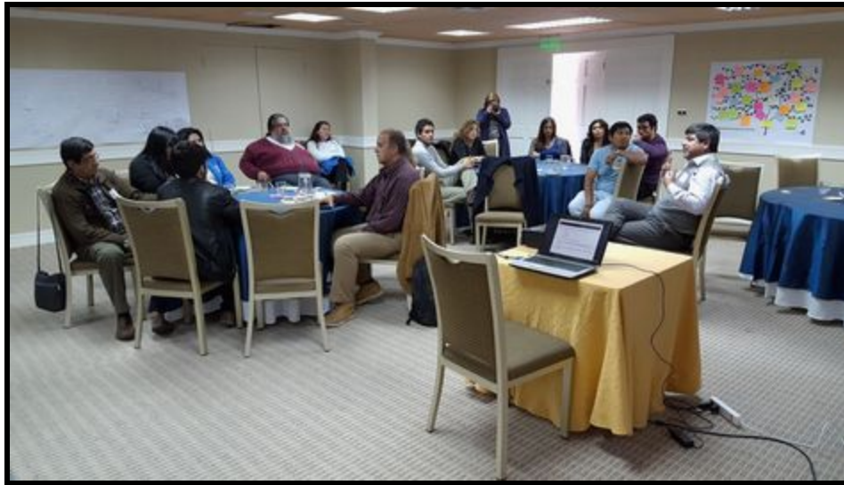
Director Regional SENCE dirigiéndose a participantes