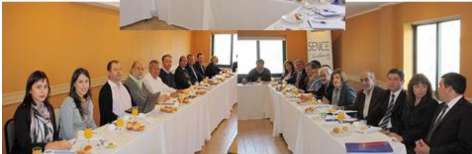
Consejo Regional de Capacitación

Ministerio del Trabajo y Previsión Social